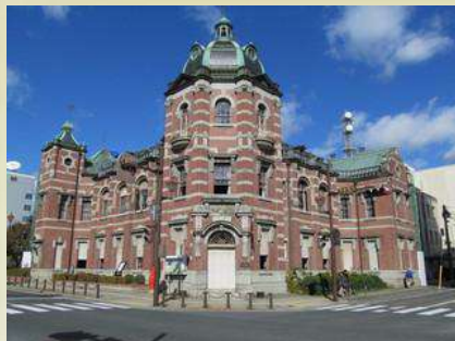
岩手銀行赤レンガ館