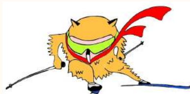
クロスカントリー スキー

キャラクター決定! ろう者の“ろう”と 幸福の“福”を 掛け合わせてふくろう 名前は“ふくちゃん”