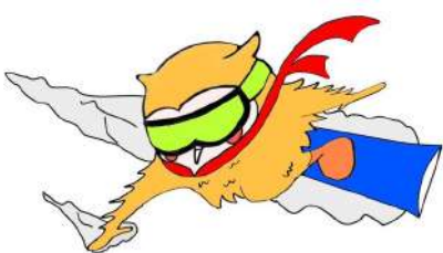
アルペン スノーボード