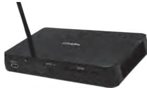
聴覚障害者用情報受信装置 「アイ・ドラゴン4」

「アイ・ドラゴン4」は、きこえない・きこえにくい方の日常生活用具としてご利用いただけることはもちろん、緊急災害時にはすべての人に必要な情報をお届けする 情報アクセシビリティ対応機器 です。全国の避難所となる福祉施設や高齢者施設定期的に防災訓練を繰り返すことが緊急災害時に人命を守ることに繋がります。