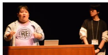
第3分科会 「国際とデフリンピック」