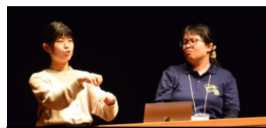
第5分科会「福祉制度」