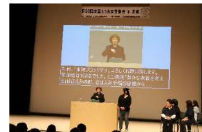
第3分科会『豊かな老後』