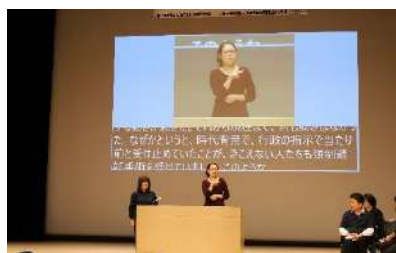
第4分科会『女性活動』