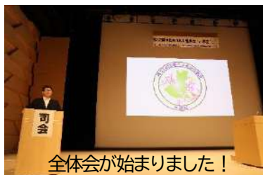
全体会が始まりました！