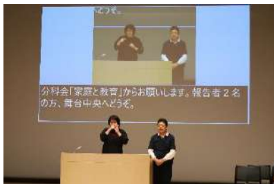
第1分科会『家庭と教育』