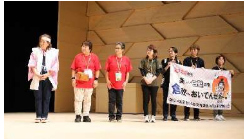
「第54回全国ろうあ女性集会 in 岡山」実行委員会一同