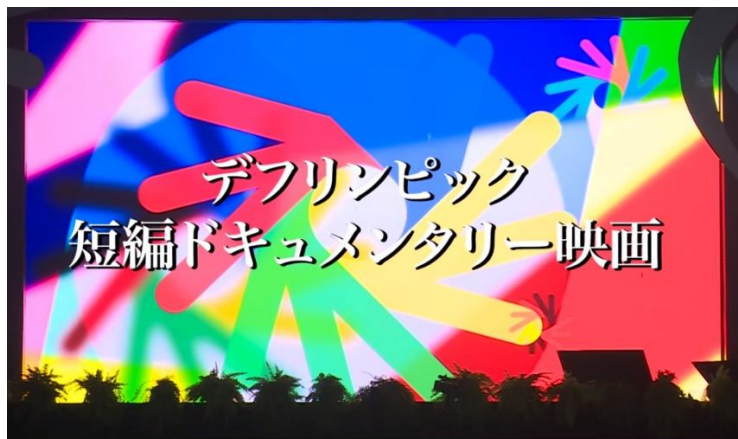
製作：一般財団法人 全日本ろうあ連盟 スポーツ委員会 制作：認定NPO法人 障害者放送通信機構

デフリンピックが2025年に日本で初めて開催されることを機に、一人でも多くの方にデフリンピックを知っていただけるよう、全日本ろうあ連盟スポーツ委員会が映画「みんなのデフリンピック」を製作しました。上映活動期間は、2025年10月31日まで(予定)です。上映についての詳しいことは、全日本ろうあ連盟のHPをごらんください。