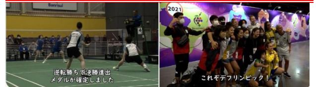
逆転勝ちで決勝進出 メダルが確定しました