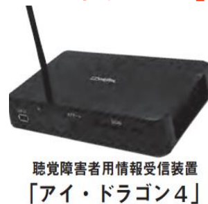
聴覚障害者用情報受信装置 「アイ・ドラゴン4」

認定特定非営利活動法人 障害者放送通信機構は、文化庁からリアルタイム字幕配信事業者の指定を受けています。