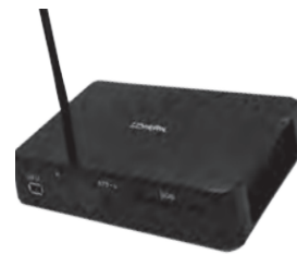
聴覚障害者用情報受信装置 「アイ・ドラゴン4」

認定特定非営利活動法人 障害者放送通信機構は、文化庁からリアルタイム字幕配信事業者の指定を受けています。