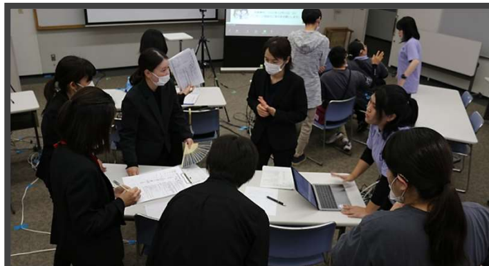
閉会式の打ち合わせ