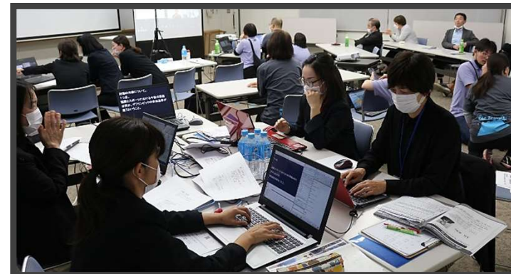
要約筆記の調整をしている様子