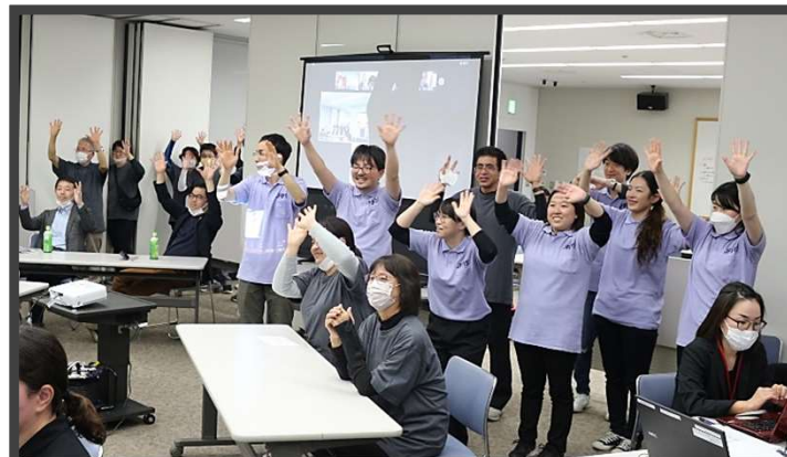
閉会式を終えた瞬間