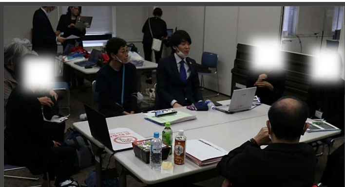
入門講座の打ち合わせ