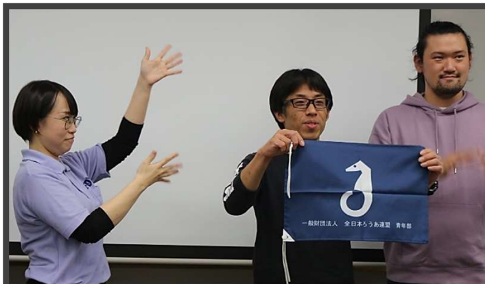
次回開催地の和歌山県に旗渡し