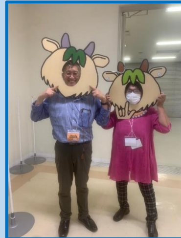
6月広島大会で 顔ハメをやりました！