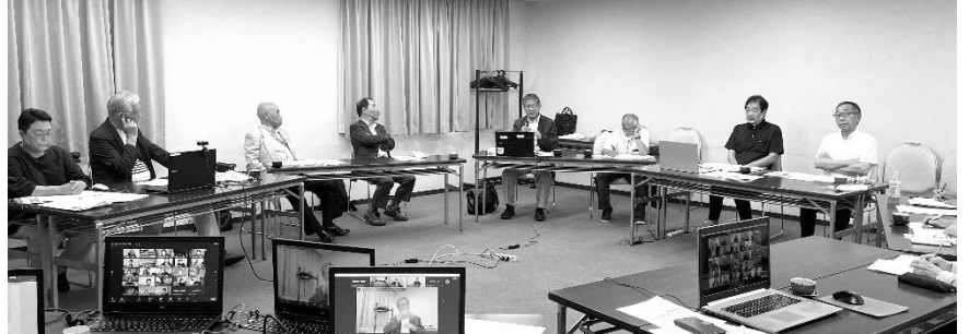
みなさま、京都までお越しくださいました

6月18日（土）、研修センターにて幹事会と運営委員会を開催しました。オンラインと集合の平行実施でした。集合は3年ぶり。全日ろう連・全通研・土協会・研修センターからそれぞれ代表のご挨拶をいただきました。