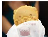
←かわうそくん焼き