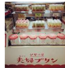
めおと 夫婦かわうそプリン→