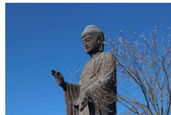
⑥牛久市 (世界一の大きさのブロンズ製仏像である牛久大仏)