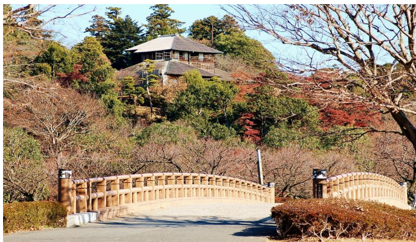
①県庁所在地である水戸市 (日本三名園のひとつである偕楽園)