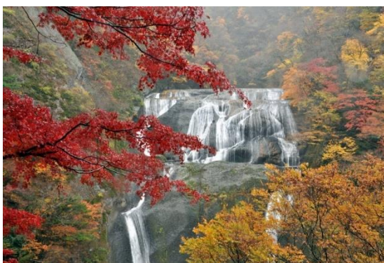
④大子町 (日本三名瀑のひとつである袋田の滝)