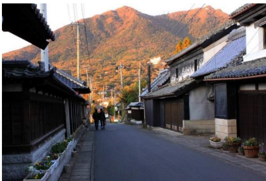
⑤つくば市 (日本百名山である筑波山)