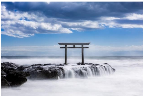
③大洗町 (大洗磯前神社)