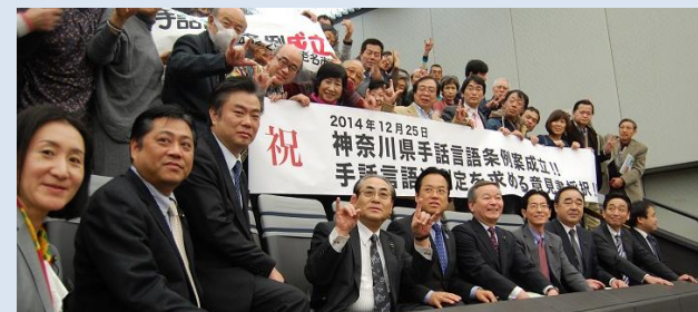
(神奈川県手話言語条例成立後、県議員と一緒に)

また、自動的に上部団体(『神奈川県聴覚障害者連盟』、『関東ろう連盟』、『全日本ろうあ連盟』)の会員になりますので、関東ろう者大会や全国ろうあ者大会など関東、全国規模の行事に参加できます。